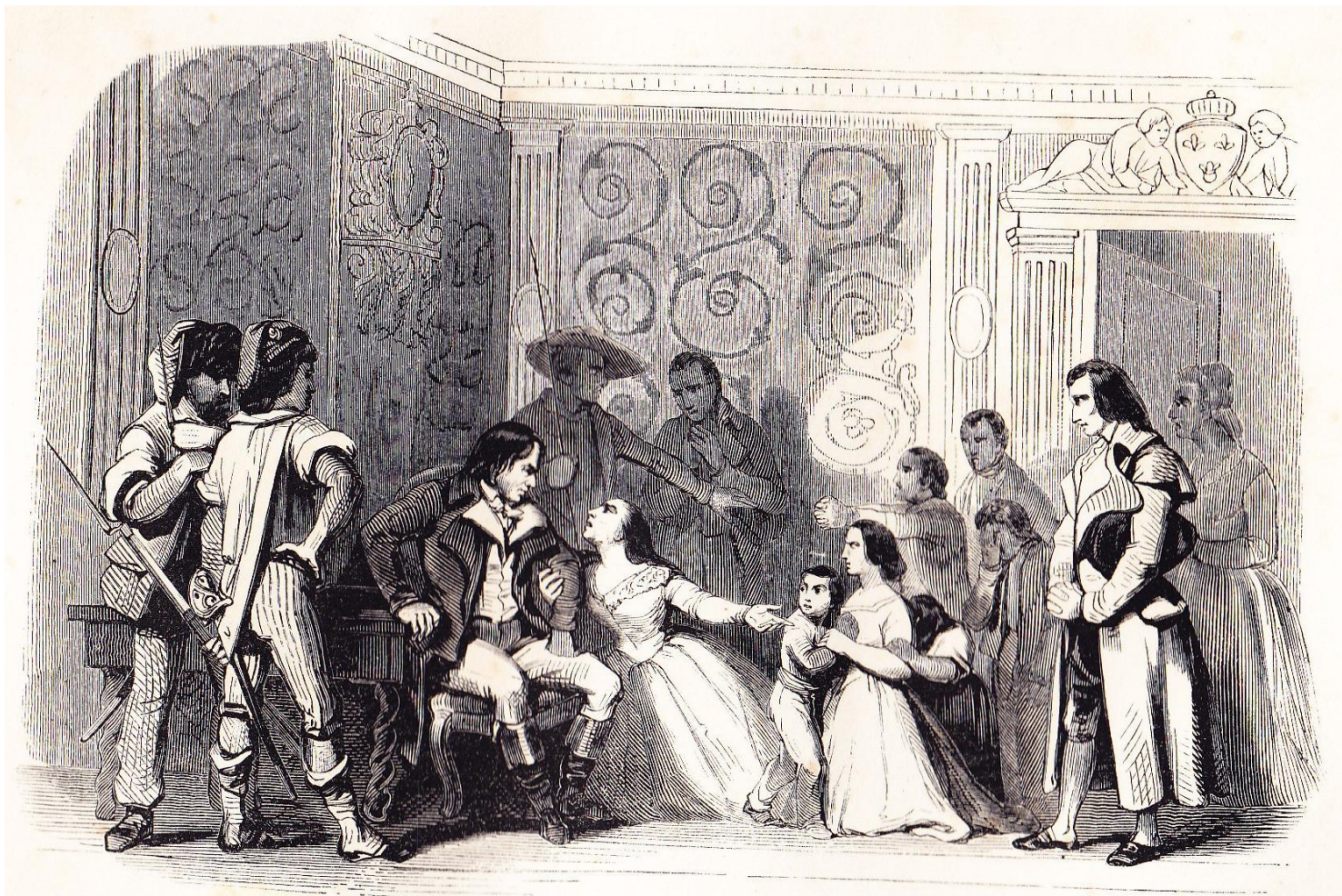
Carrier à Nantes.